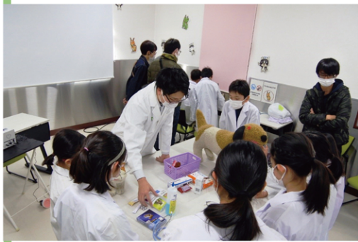
獣医師体験プログラムの様子

や自分以外の「いのち」の大切さ、「いのち」への共感ができる子どもを育てることをねらいとしています。 この2つのプログラムには、公益社団法人日本動物病院協会の訪問活動の経験豊富なボランティアさんとその愛犬に参加協力していただいています。 「獣医師体験プログラム」子どもたちに人気の