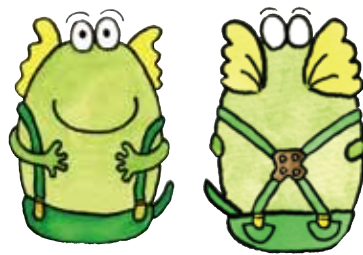
幸せ (ハウオリ) Hau'oli (Happiness)

We should feel 'happy' for all the other creatures that live