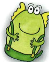
ハウオリ (Hau'oli) 幸せ

会場内には、国際会議のエキシビションの会場を併設し、広く一般の情報交流の場とすると共に、大学や専門学校の学生の皆さんの発表の場を創り、教育機会も提供したいと存じております。