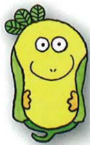
プカ・コモ (puka komo) 扉