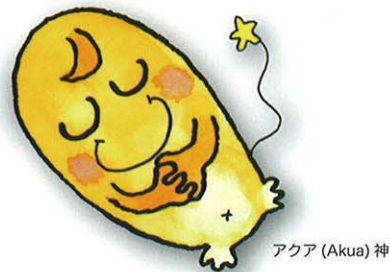
アクア (Akua) 神

※「アクア（神）」と「プカ・コモ（扉）」ハワイ語で二人で「神の扉（神戸）」という意味です。 「ハウオリ（幸せ）」「マハロ（感謝）」「クレアナ（責任）」はアニマルケアのキーワードを表現しています。