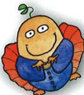
クレアナ (kule.ana) 責任

本展示会は、2年に1度の開催を目指しており、アニマルケア事業において神戸から情報発信し、この業種における世界の中でのオピニオンリーダーとしての地位を確立出来るよう、精進して参りたいと存じております。