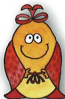
マハロ (mahalo) 感謝

近年、人と動物の関係性が注目され、アニマルケアに関わる分野にも様々な企業にご参加下さり、沢山の商品が開発、販売されています。動物に関わる分野は、ユーザーのニーズが的確に伝わることで、更に素晴らしい商品が生まれる、大きな可能性を秘めた市場であると感じております。そこで、本展示会は、ユーザー、専門家、メーカーの三者がダイレクトに交流できる「場の創出」を目的に開催致します。